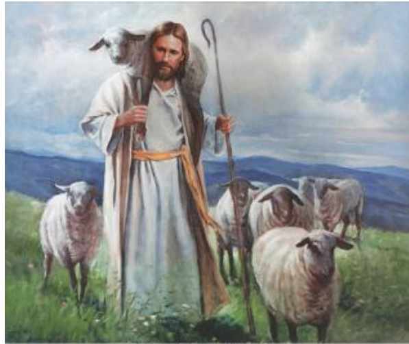
The Good Shepherd by Del Parson