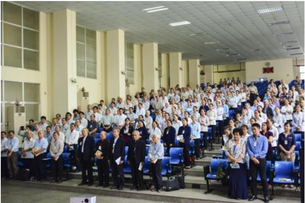
Hội Thảo Viên