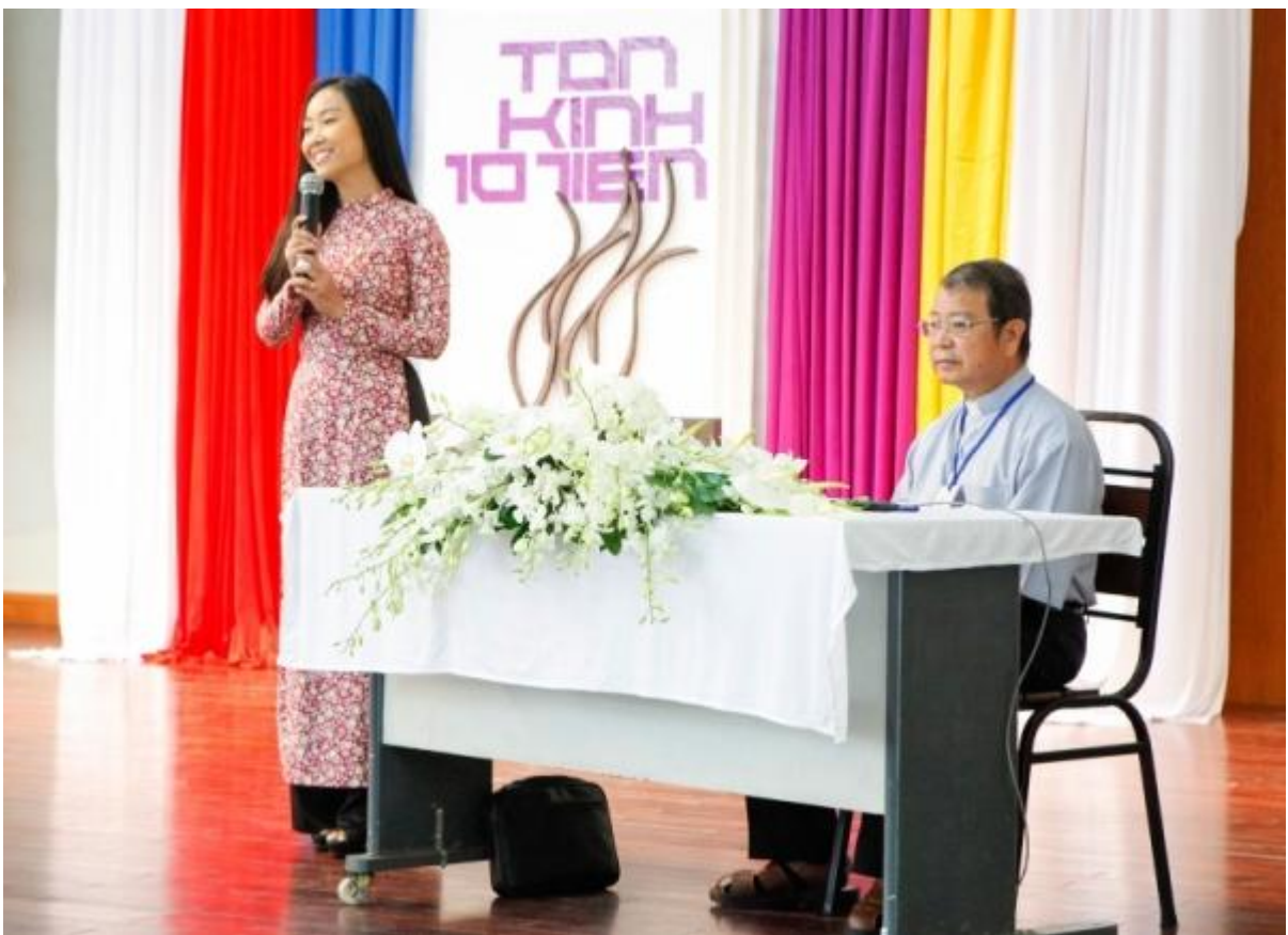
Ca Sĩ Đoàn Trang