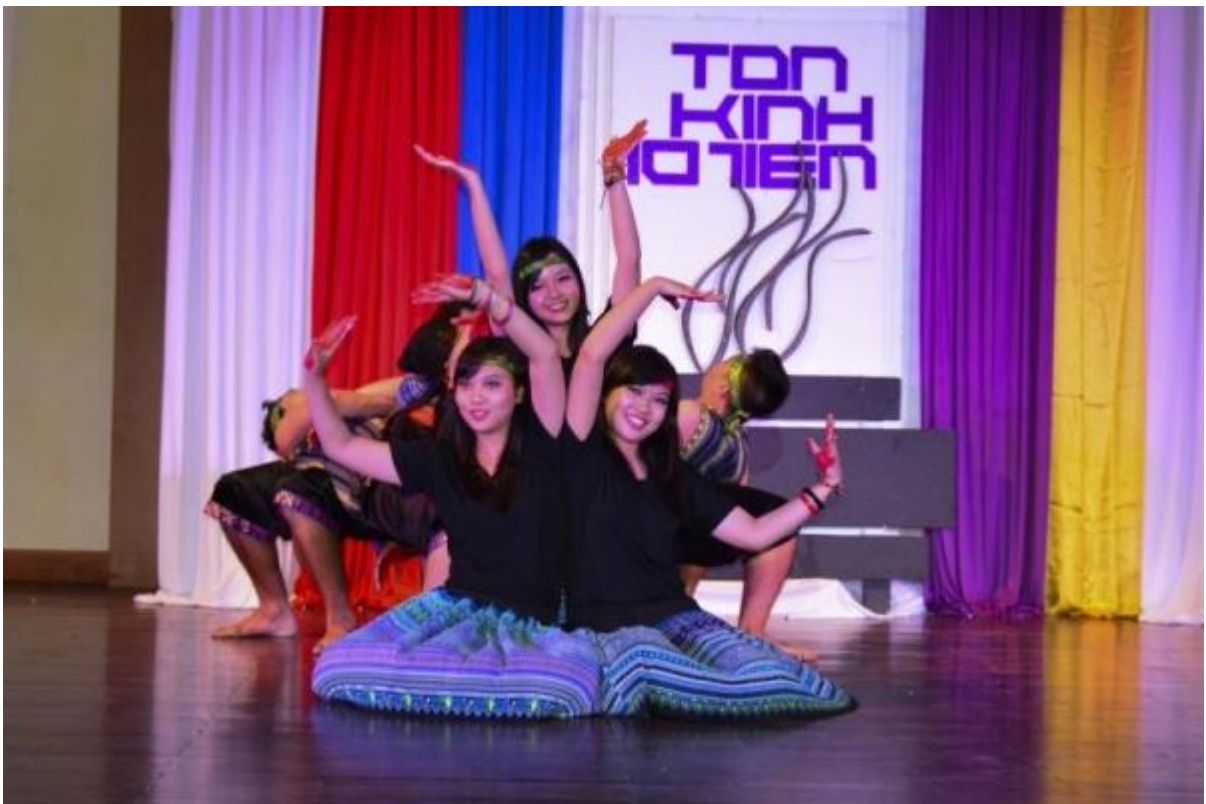
Vũ Khúc Dệt Tầm Gai, nhóm vũ Hoa Cúc Vàng