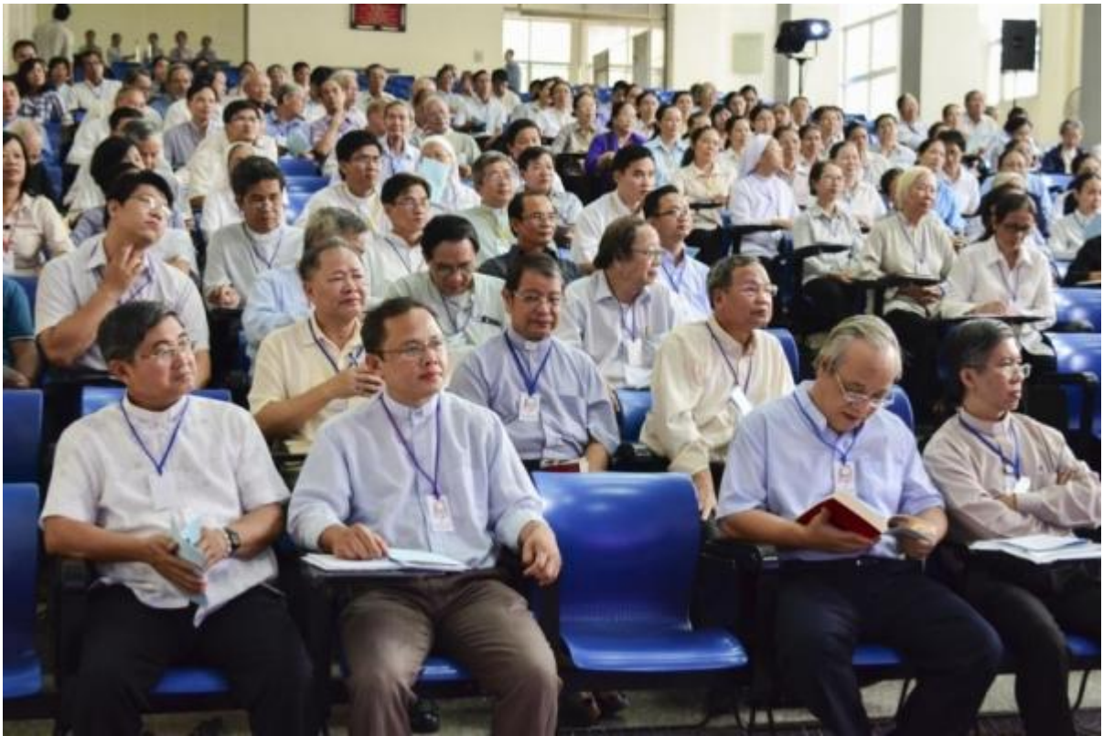
Hội Thảo Viên