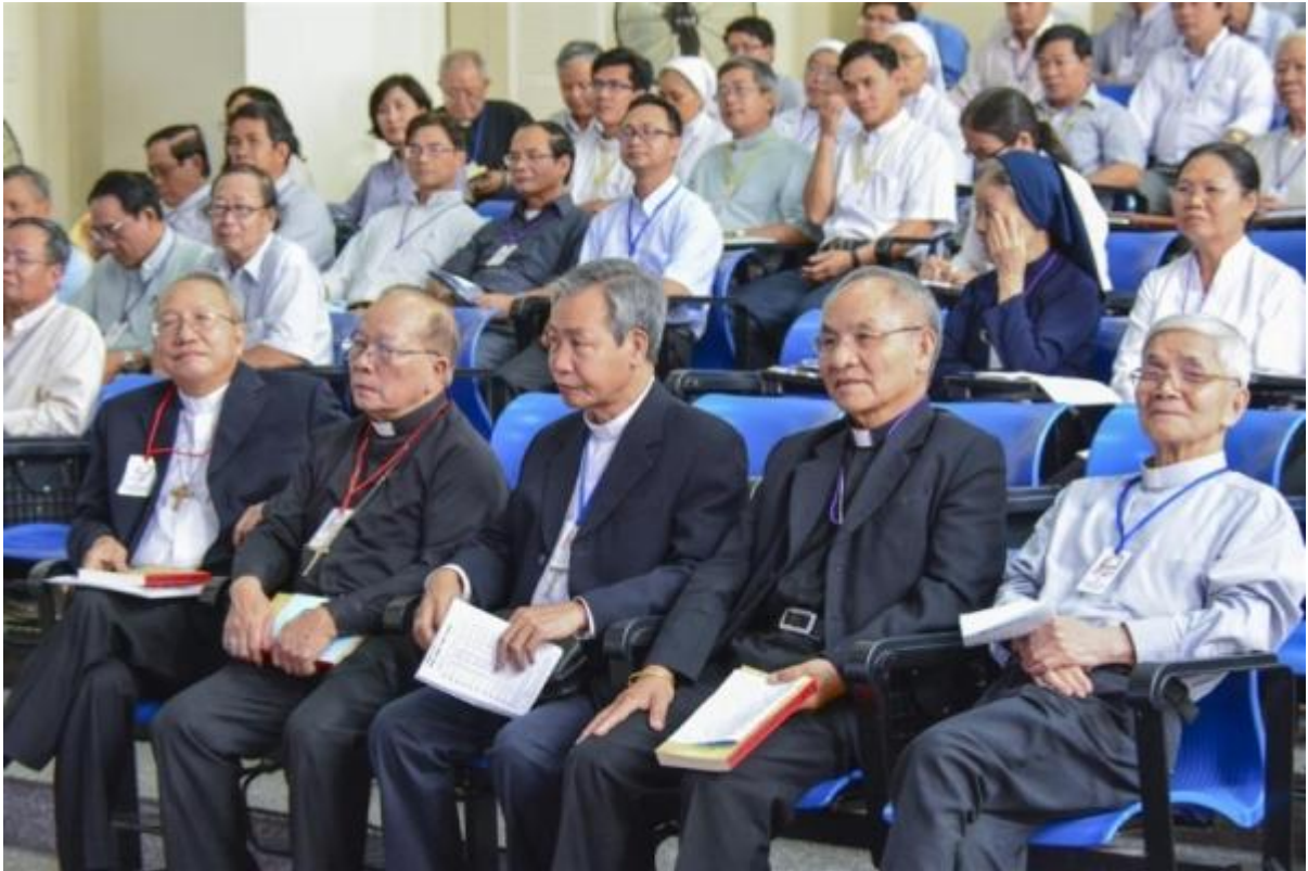
Các Đức Cha và Đức Ông