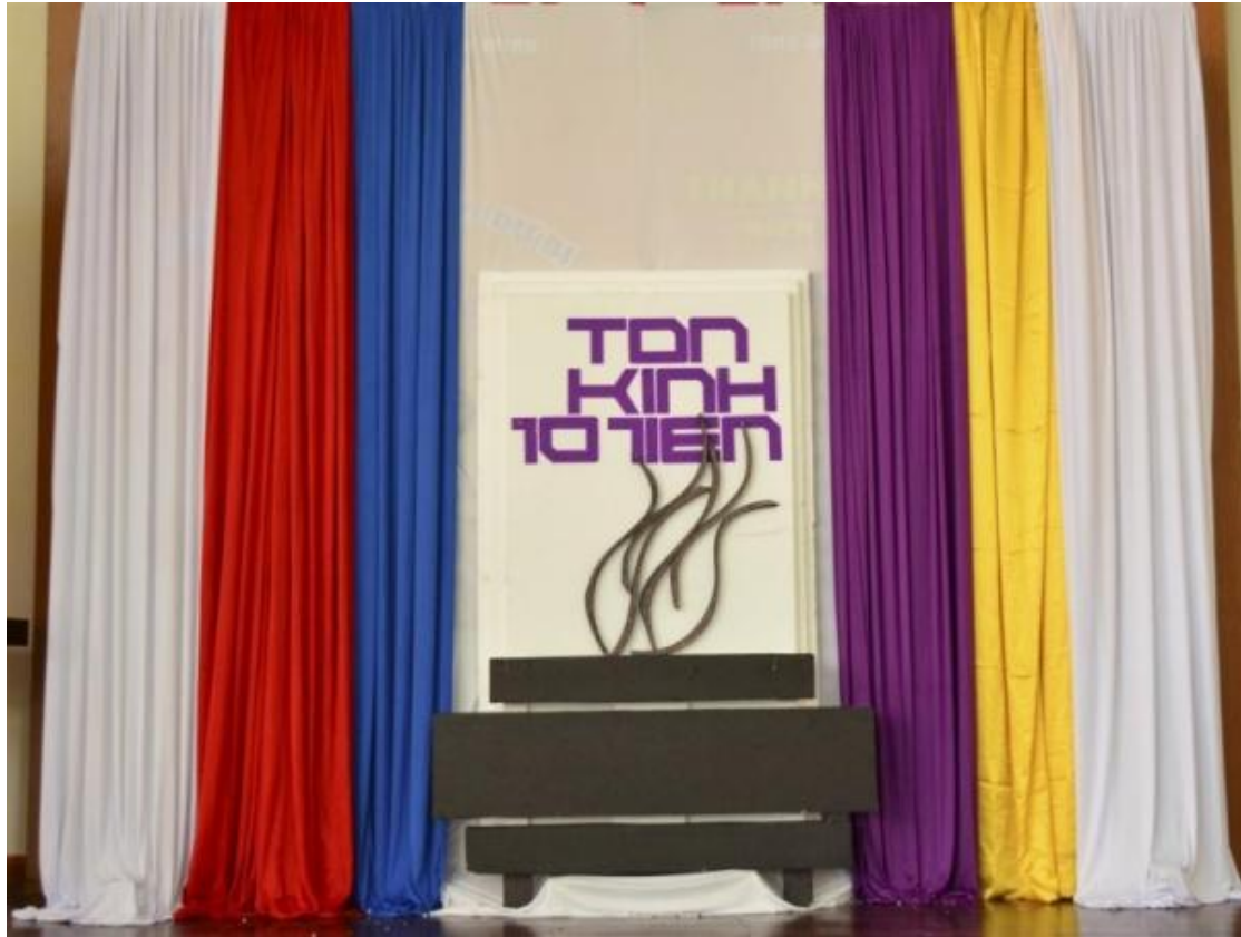
Minh họa chủ đề cuộc hội thảo: Lòng Tôn Kính Ông Bà Tổ Tiên