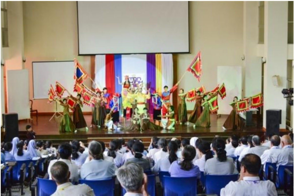
Nhạc Cảnh Hùng Vương Lập Quốc, nhóm vũ Vinh Sơn